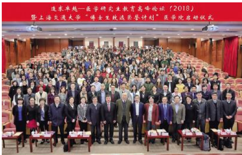
追求卓越—医学研究生教育高峰论坛(2018)暨上海交通大学“博士生致远荣誉计划”医学院启动仪式

在当天上午的论坛中，中国工程院院士巴德年，清华大学医学院院长董晨，华中科技大学同济医学院院长陈建国，上海交通大学医学院院长陈国强应邀在论坛大会上作主旨报告。