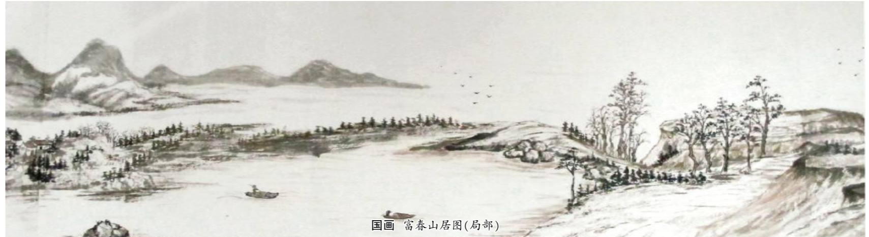
国画 富春山居图(局部)